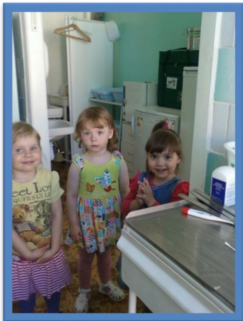
Экскурсия в медицинский кабинет